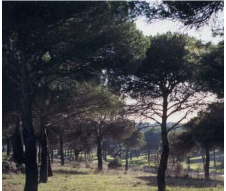
En la imagen, el Pinar de la Dehesa de Navalcarbón

Es una buena ocasión para acercar a los escolares, de una forma lúdica, a la importancia del respeto y preservación del entorno natural, una de nuestras riquezas más importantes.