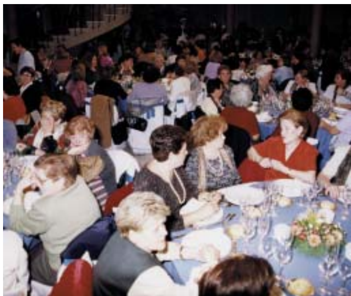
Los Encuentros siempre son multitudinarios

Organizada por la Asociación Arte y Artesanía y la Asociación Sociocultural de Mujeres de Las Matas , esta exposición podrá visitarse durante toda la semana en el Centro de Servicios Sociales y Mujer de Las Rozas.