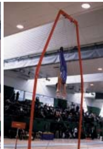
Dos momentos del Encuentro España-Grecia