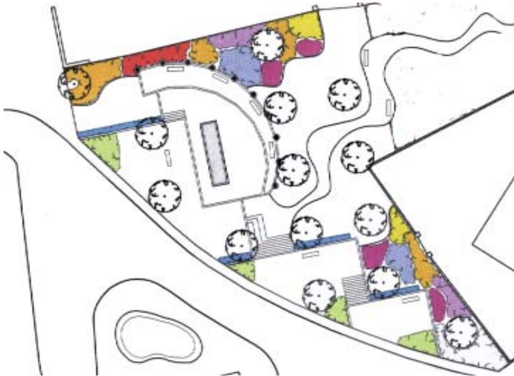
En la imagen, el proyecto de recuperación de El Caño como zona verde urbana.

No se pretende modificar la Fuente, dado que se trata de un lugar emblemático del municipio, el objetivo es preservar su carácter histórico , realzando su presencia, para lo que se saneará y acondicionará tanto su vaso de agua como la superficie en la que se encuentra emplazado, donde lucirá una placa conmemorativa a todos los hombres y mujeres que le dieron vida.