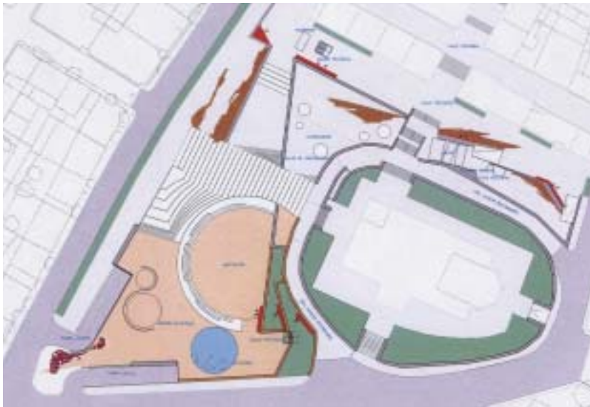
En la imagen, proyecto de los jardines de la Iglesia