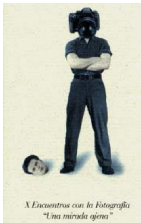
Diez años de Encuentros con los mejores fotógrafos.

El 5 de marzo, además, se presentará el catálogo recopilatorio de los Diez Años de Encuentros. Estas Jornadas Fotográficas están organizadas por la Concejalía de Cultura y Taller de Arte, y en colaboración con CajaMadrid Obra Social.