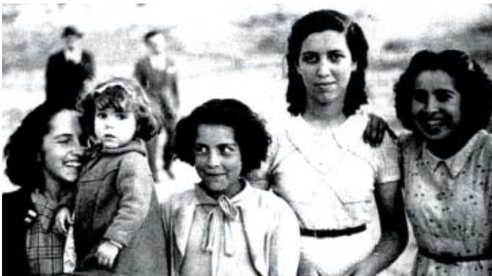
Un homenaje a todas las personas que le dieron vida durante décadas

Se combinarán distintas especies vegetales : árboles, arbustos y flor de temporada, creando así una zona verde que irá modificando su aspecto con las distintas estaciones del año.