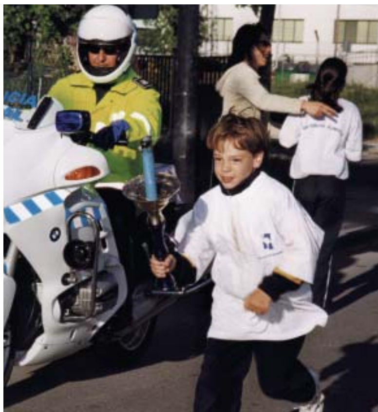
El recorrido de la antorcha es uno de los momentos más emotivos

El 7 de abril tendrá lugar la ceremonia de apertura de los VIII Juegos Olímpicos Escolares . Este acto dará comienzo con el recorrido de la antorcha olímpica desde la Plaza Mayor hasta el Polideportivo de la Dehesa de Navalcarbón. Durante el recorrido, los miembros de los equipos de los distintos Centros Educativos que participan en la Edición irán relevándose en lo que es, sin lugar a dudas, uno de los momentos más emotivos.