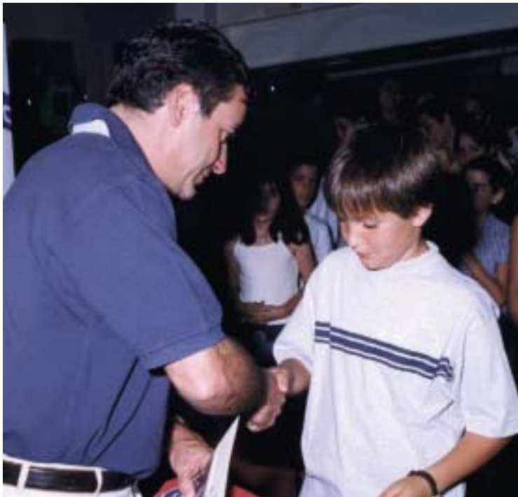
Sainz en la entrega de premios de la pasada Edición