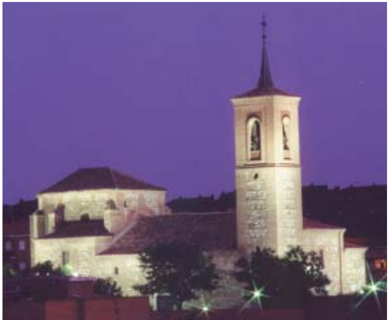
La Iglesia de San Miguel es el edificio más emblemático del municipio.

La vegetación de esta zona estará compuesta por especies autóctonas , tanto árboles como arbustivas. La inversión municipal será de 1.502.530,26 €.