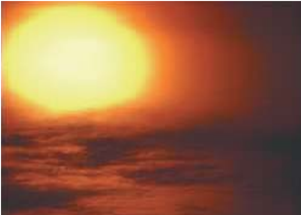
El Sol es una fuente inagotable de energía.

El pasado 23 de enero dió comienzo el Ciclo de Jornadas sobre Desarrollo Sostenible y Municipio . Este ciclo, que constará de tres conferencias, estará dedicado a resaltar las posibilidades de las energías “limpias renovables” .